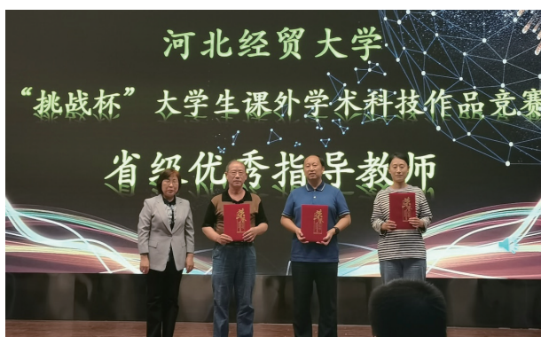
◇经济学系教师荣获“挑战杯”省级优秀指导教师荣誉称号

专业核心课程包括数字经济学、数字政府治理、区块链技术与应用、平台经济学、商业大数据分析、数字化运营、数据挖掘应用、人工智能技术及应用、数据要素理论与应用、产业数字化转型理论与实践、电子支付、跨境电子商务,旨在培养具有数字经济领域专业知识、信息技术、家国情怀、职业素养和国际视野的复合性应用型高素质财经人才。