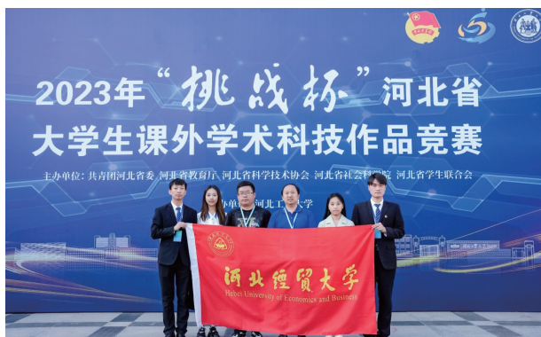
◇经济学系教师带领经济学专业学生参加“挑战杯”省赛