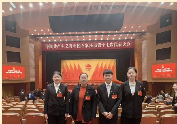
◇经济学专业学生参加共青团石家庄市第十七次代表大会