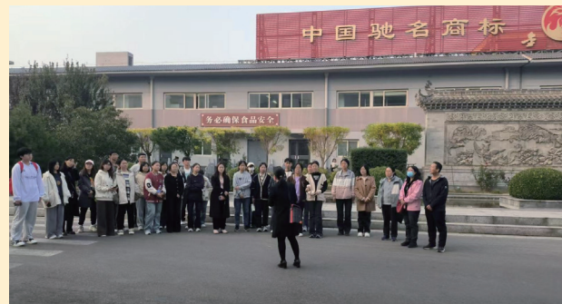
◇专业社会实践 -- 金凤扒鸡