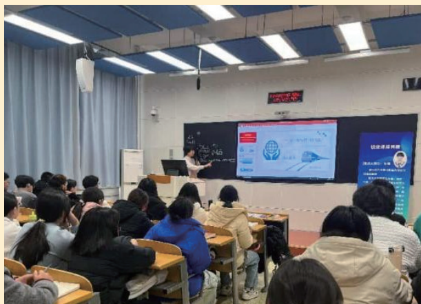
◇校企共建课程 -- 企业专家授课

在校本科生和研究生 2179 人，现有教职工 100 人，其中高级职称 58 人，博士学位 60 人，形成了一支老、中、青相结合，以中青年教师为骨干，理论水平高、实践能力强的师资队伍。拥有经济学、国家经济与贸易、贸易经济、数字经济四个本科招生专业，应用经济学和理论经济学两个一级学科硕士学位授权点及国际商务专业硕士点，产业经济学和理论经济学两个省级重点学科。形成了以“双一流”学科和省级重点学科为龙头，四个本科专业协调发展，本科教学与研究生教学相互促进，教学与科研相互提升的良好发展态势。