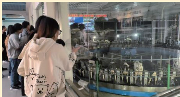
◇专业社会实践 -- 君乐宝优质牧场

学院现有贸易经济、国际经济与贸易、经济学、数字经济四个本科专业；其中贸易经济专业为国家一流专业建设点，国际经济与贸易专业为国家级特色专业，经济学专业为省级一流专业建设点，数字经济专业为我校“新财经”改革重点建设专业，“贸易与法律教育创新高地”为河北省高等学校本科教育创新高地。各专业均具有硕士研究生推荐免试资格。