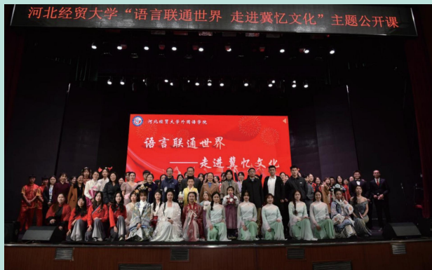
◇“走进冀忆文化”大型思政主题公开课

商务英语专业采用个性化递进式培养模式，构建应用能力培养为先导的课程体系，创设国际视野下的对外交流与学习平台。主要课程包括：综合商务英语、商务英语视听说、商务英语写作、国际贸易原理、商务英语翻译、国际贸易实务、商务英语口译、国际商务谈判、学术写作与研究等。本专业高度重视学生实践能力的培养，配备国内领先的虚拟仿真实验室和实训平台，满足专业实践教学需要。同时，签约多家外贸企业作为校外实习实训基地、组织学生参加各类商务英语赛事，旨在提升学生的实践能力，为学生未来深造、从事翻译、国际贸易、国际商务及其他相关工作打下坚实基础。