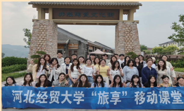
◇2025年课程实践-井陘陶瓷文化街区