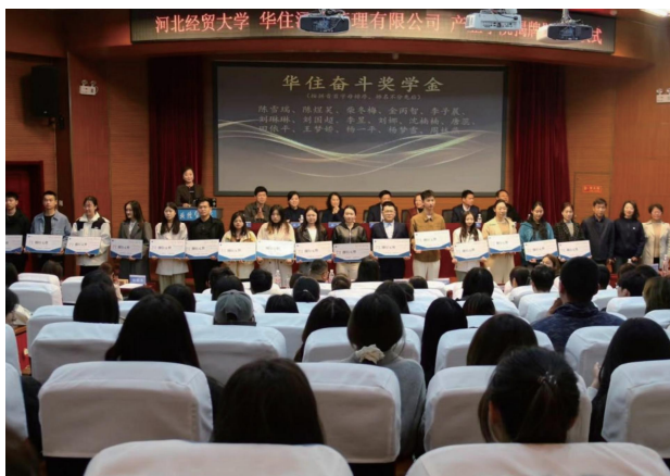
◇ 学生荣获华住集团企业奖学金

就业方向: 面向国际品牌酒店集团、国内龙头连锁集团及文旅综合体等新业态住宿业,从事商业智能分析、运营管理、收益管理、数字化运营、新媒体传播等岗位,亦可考研、留学深造或进入文旅相关事业单位工作。