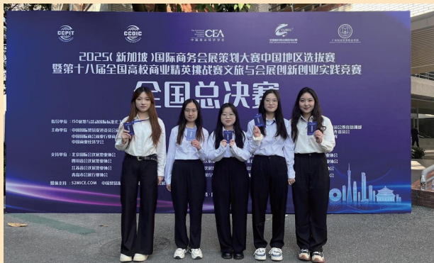
◇专业学生参与全国高校商业精英挑战赛取得优异成绩

地管理、旅游消费行为学、旅游接待业、旅游经济学、旅游规划与开发、文旅产业项目运营、文旅产业政策与法规、旅游新业态与创新创业、旅游数据统计 AI 实操、旅游大数据理论与应用等。