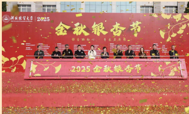
◇专业师生策划运营金秋银杏节

学院选派科技特派员,成立旅享社会服务团,扎根长城太行山沿线,完成多个区域文旅发展项目,助力经济强省、美丽河北。