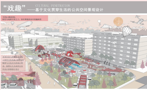
◇ 全龄友好型智慧化城市会客厅设计

主要就业方向: 交互设计师、虚拟现实艺术家、艺术创作者、AI 造型设计师、3D 数字造型师新媒体艺术教育者、品牌视觉顾问、教师及各级政府城市艺术与管理相关部门公务人员。本专业有硕士研究生推免资格。