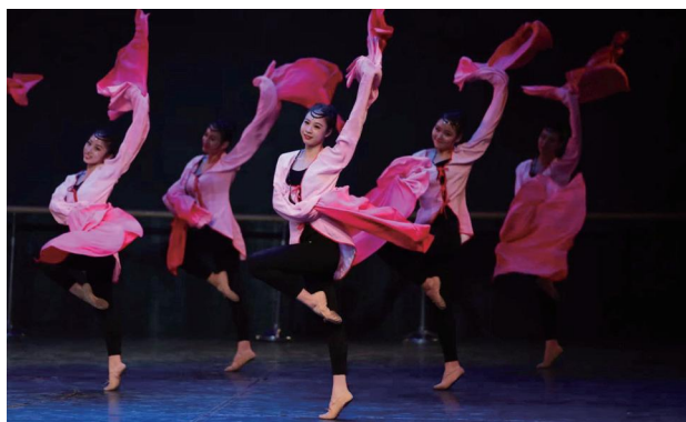
◇《中国古典舞水袖训练组合》

就业方向：文化机构、文艺演出团体、教育机构、文化管理部门，以及社区康养中心、心理健康服务机构、文旅康养产业等新兴领域。本专业有硕士研究生推免资格，近年毕业生升学率近10%。