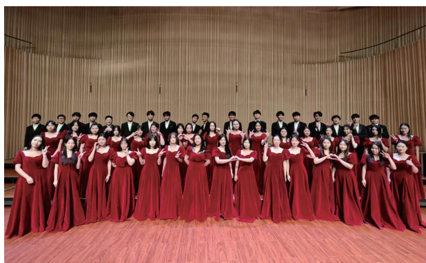
◇J.M合唱团在省艺术中心参演《芳华如歌 2025 合唱新年音乐会》